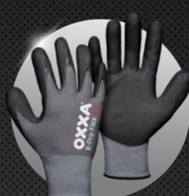
X-PRO-FLEX AIR 51-292 Art. nr. 1.51.292.00