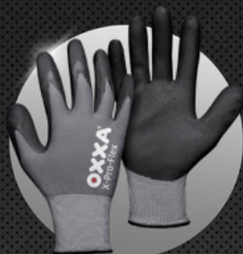
X-PRO-FLEX 51-290 Art. nr. 1.51.290.00